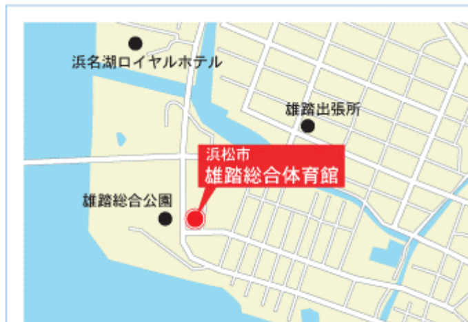
浜松市雄踏総合体育館周辺地図